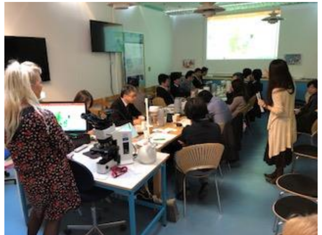
RBGB-sekretariatet havde besøg fra Japan den 20. september 2019