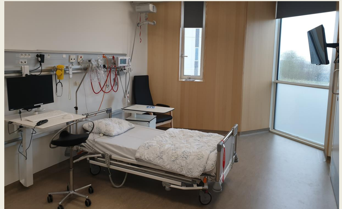
Lene Gram Udviklingskonsulent