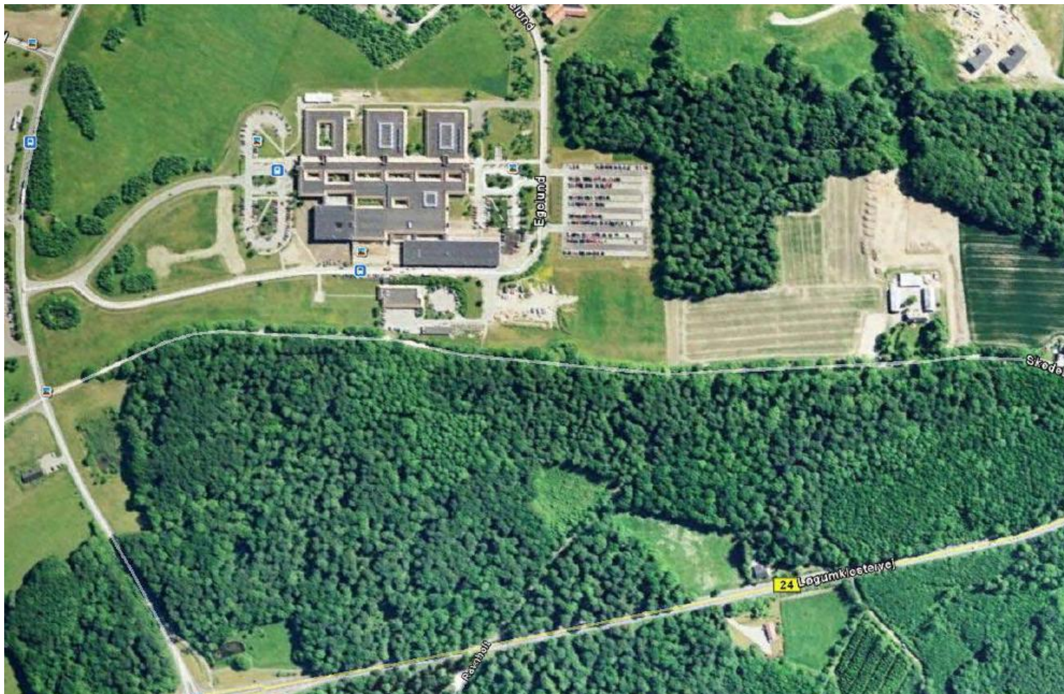
Sygehus Sønderjylland, Aabenraa