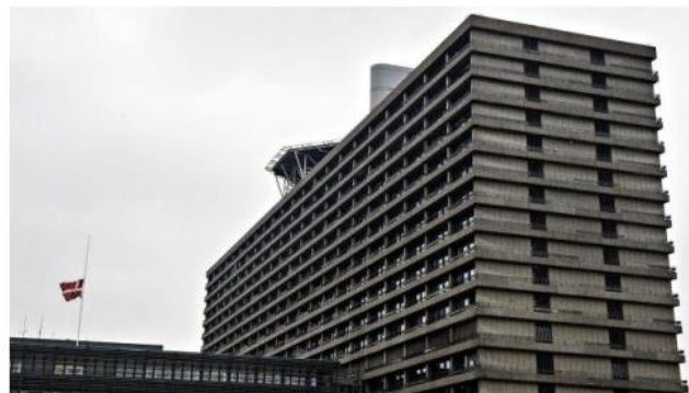
Rigshospitalet og entreprenøren er raget ukklar over byggenet af en ny nordfløj.