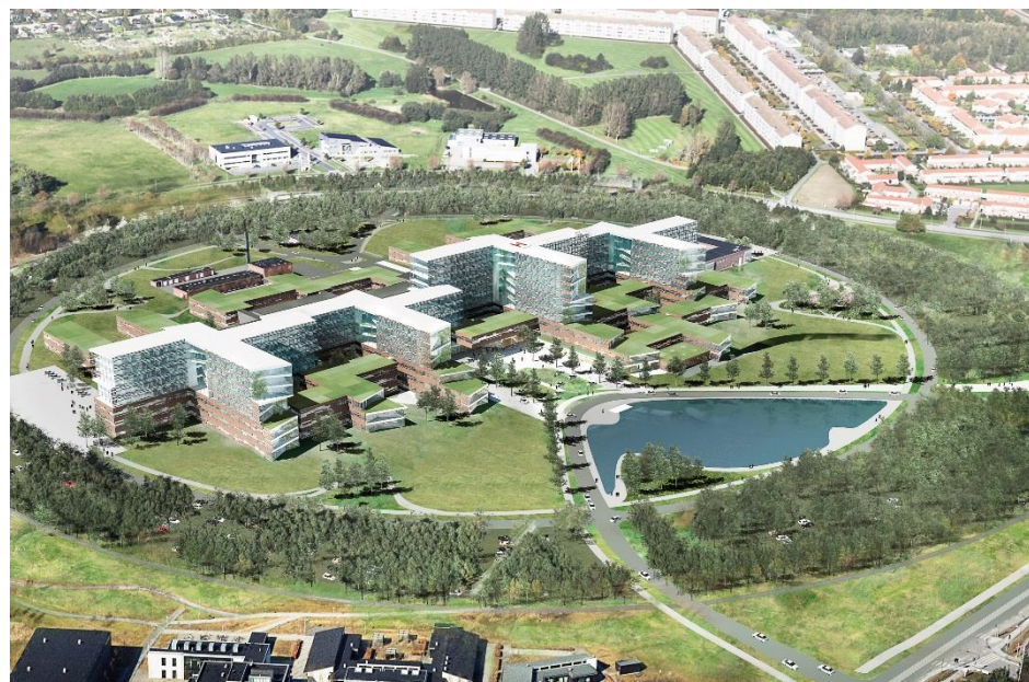
Sjællands Universitetshospital Køge